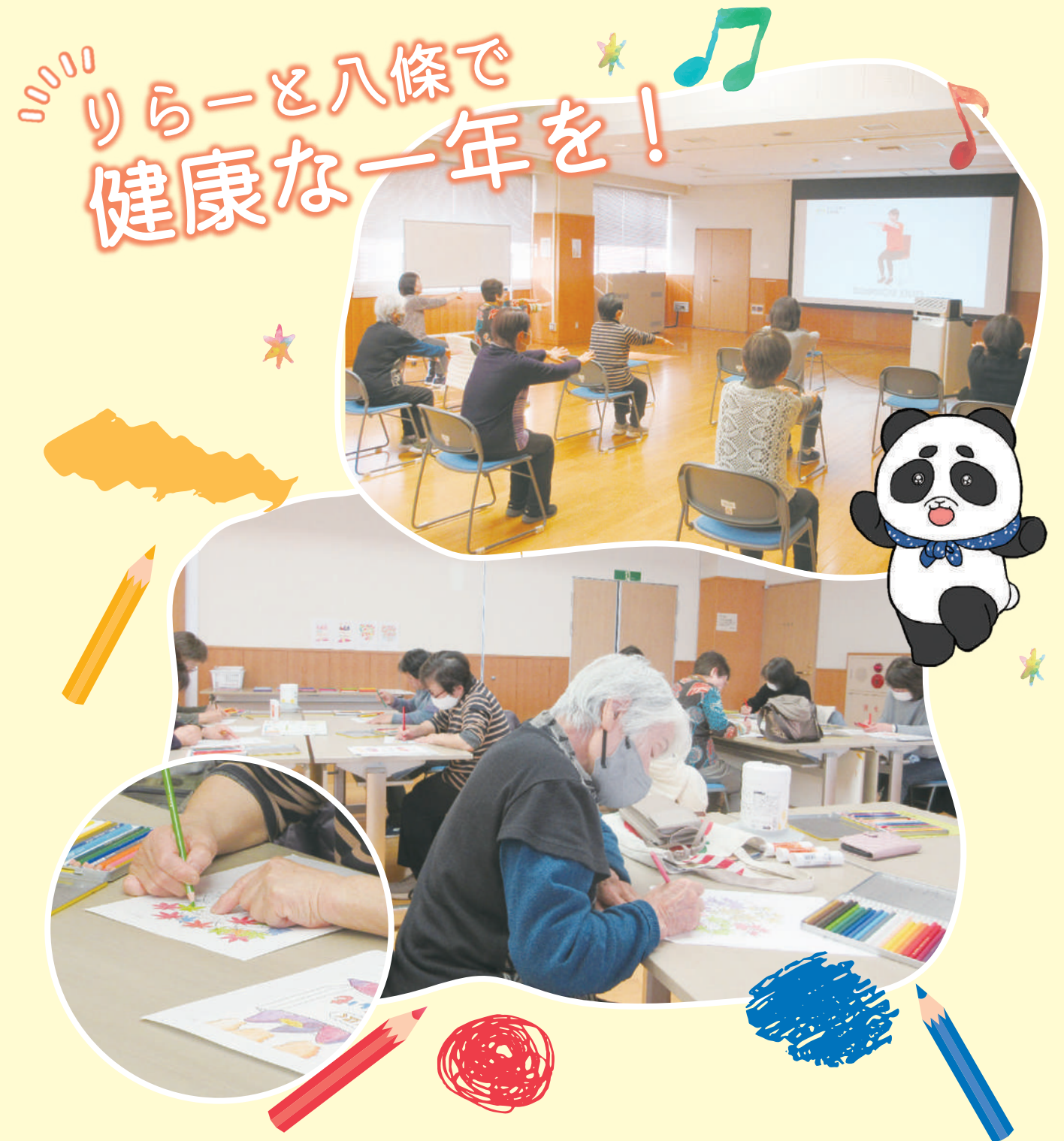
▲「脳トレ体操」「ふれあいサロン～ちぎり絵アート&ぬり絵～」の様子