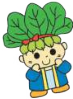
八潮市マスコットキャラクター 「ハッピーこまちゃん」

今号では、その「八潮の八つの野菜」の中から小松菜、そして枝豆についてお届けします。